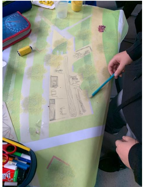
Grünflächenamt, November 2019